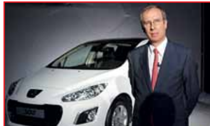
• Франсуа Пуарье

• 1 июля в России начинались продажи нового Peugeot 308. Презентация автомобиля прошла в московском Центре современного дизайна и инноваций для жизни MOD Design. Новый Peugeot 308 представлен в России в трех вариантах кузова: хэтчбек, универсал и купе-кабриолет. Цена новинки стартует с отметки 549 000 руб. Продажи модели в России начались в 2008 году, а к 2011 году их объем составил 50 000 автомобилей. Этот показатель демонстрирует постоянный рост – так, за период январь-май 2011-го объем продаж автомобилей Peugeot в России вырос на 61%, а доля 308-го составляет 49% от объема продаж всех моделей Peugeot в стране.