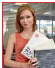
• ...А агентство «Нет проблем» найдет вам идеальных помощниц