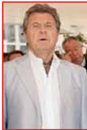
• Лев Лещенко